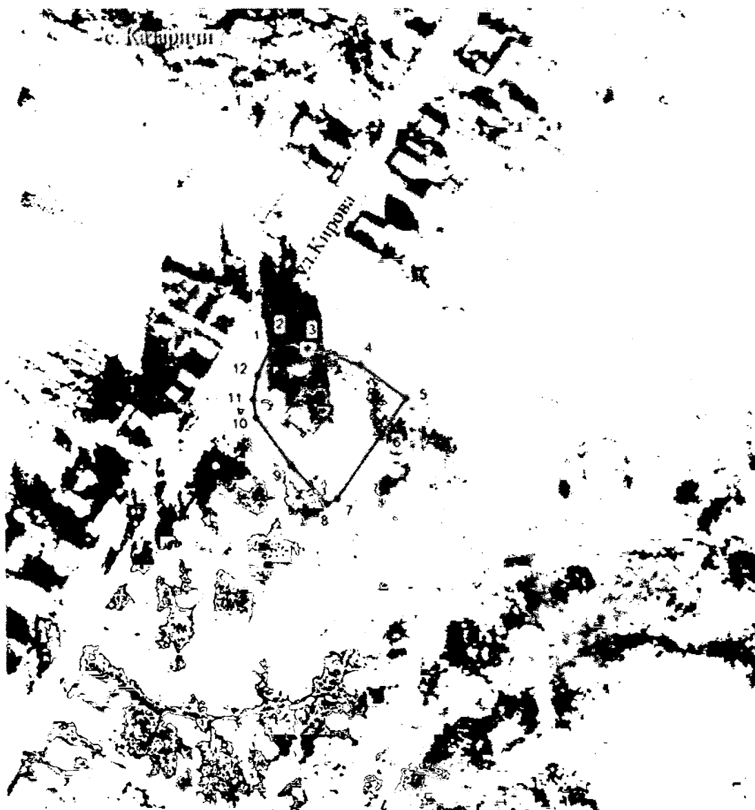
Схема границ территории объекта культурного наследия регионального значения «Никольская церковь»